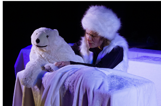
Le monde polaire