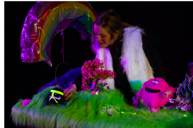
Le monde fluo, l'autre monde