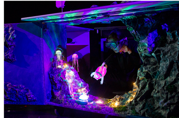
Le monde de la mer